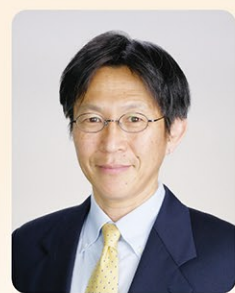
社団法人 養生会 社会福祉法人 養生会

新年明けましておめでとうございませう。 旧年中は地域の皆様、職員の皆様に支えられつつ、また一つ大きな飛躍ができた年であったと感じております。本年も地域の皆様にとつてよい1年であることを祈念いたします。 さて、日本は未曾有の少子・高齢化社会を迎え、財源も限られる中、社会保障の持続可能性を確保しなければならぬという難しい時代をむかえています。医療・福祉サービスは改革による生産性の向上が求められており、この課題のために提案されているのが「地域包括ケアシステム」です。原案は予防と介護が中心でしたが、現実には皆さんが体感している通り、高齢者の救急医療問題が大きな課題となっております。病院を中心とした高齢者医療ニーズはしばらく減少しないと予測されており、脳卒中、心不全、肺炎、骨折などの救急疾患はむしろ増加すると考えられていますから、現状の病床数が維持されても、実質的には削減を意味することになります。